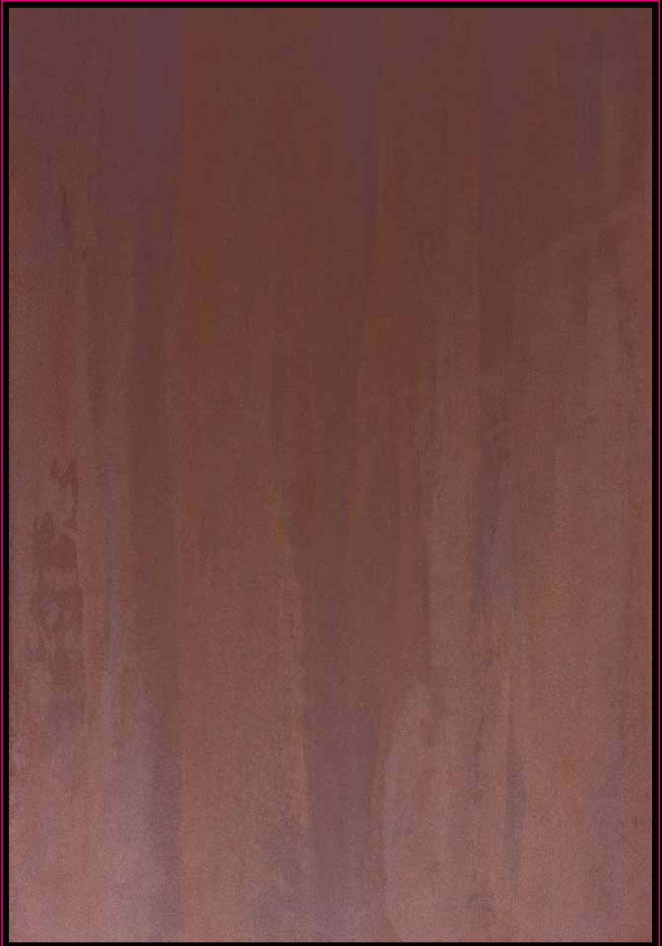
Antico Ferro Corten

Supercolor N 128 + Novalis Ferromicaceo NF 2310 + NF 2110