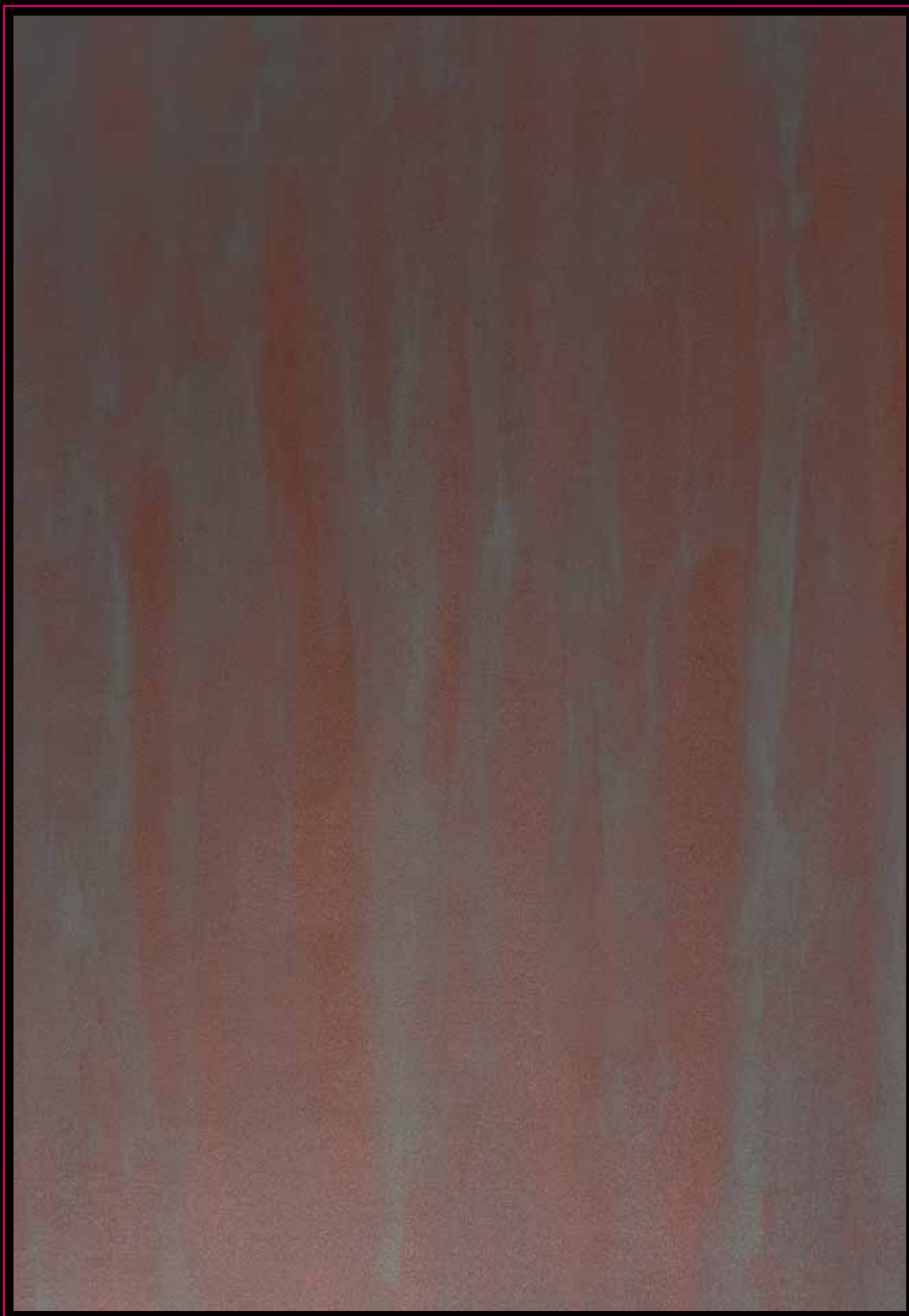
Antico Ferro Ossidato